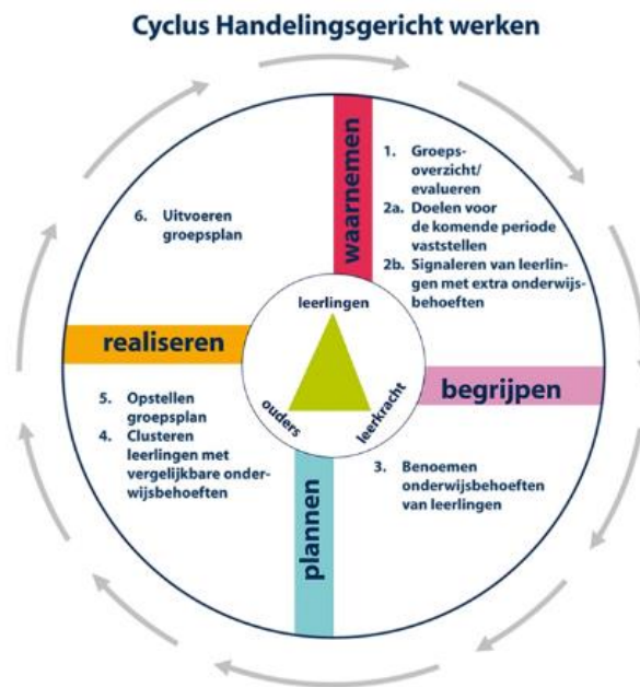
Model 1, Cyclus Handelingsgericht werken, naar Pameijer, 2018.